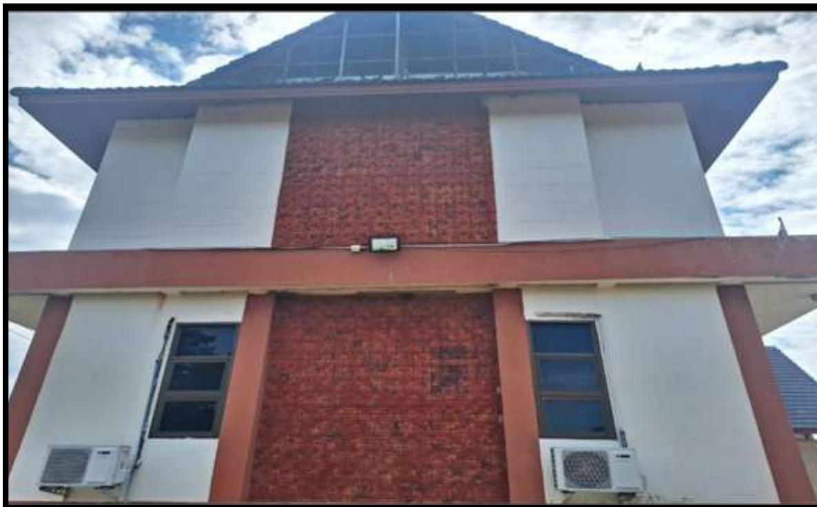
มีระบบไฟฟ้าและแสงสว่างในจุดต่างๆ