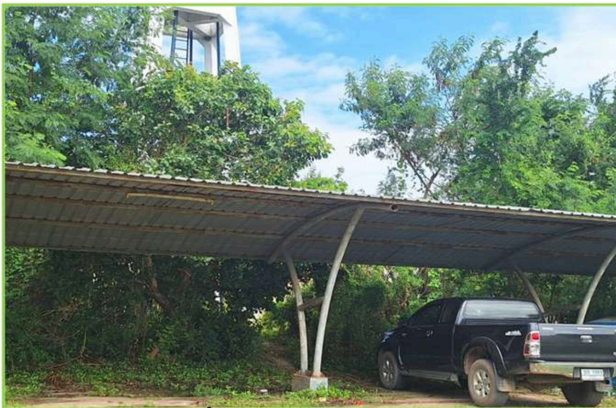
สถานที่จอดรถ