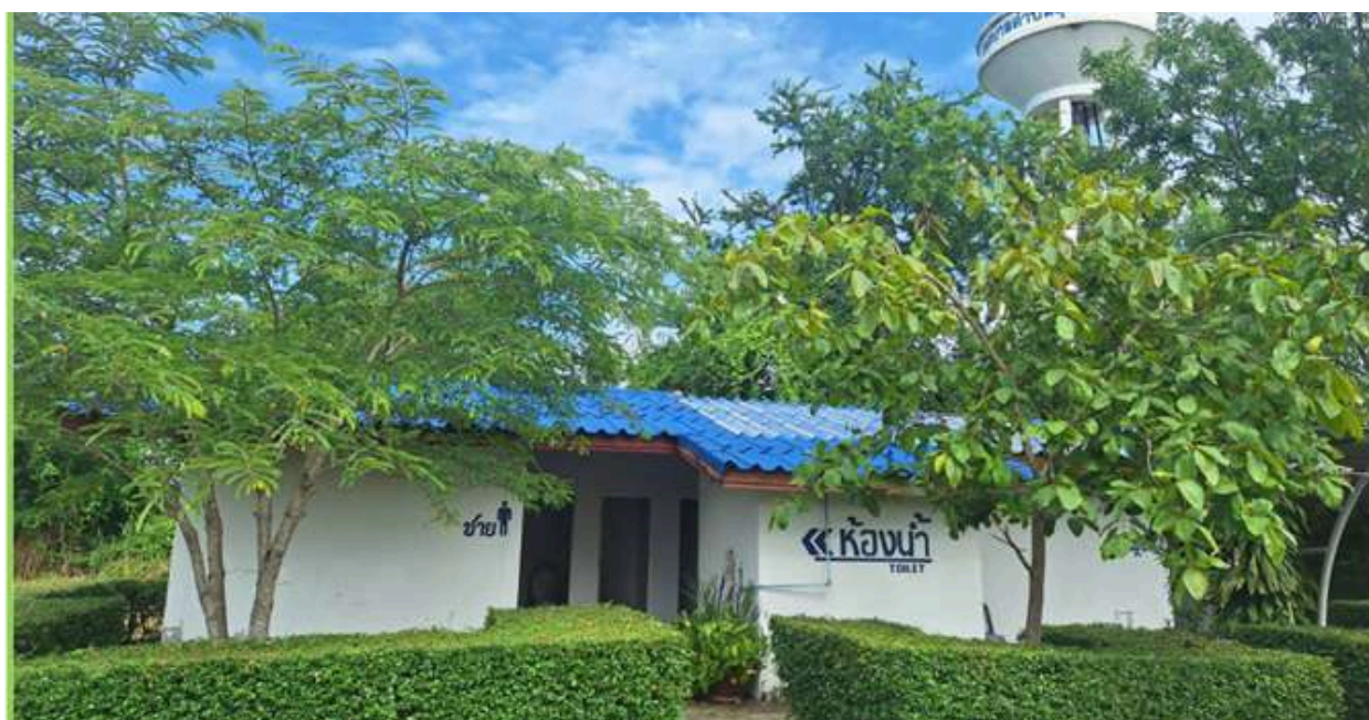
ห้องสุขาสาธารณะบริการประชาชน