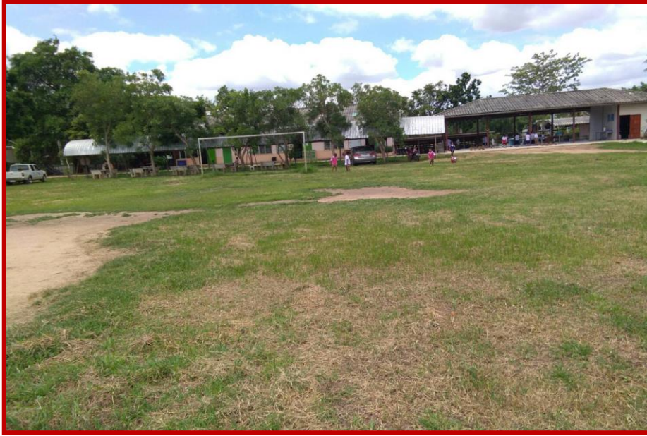
ลานกีฬาศูนย์พัฒนาเด็กเล็กบ้านไร่ หมู่ที่ ๖