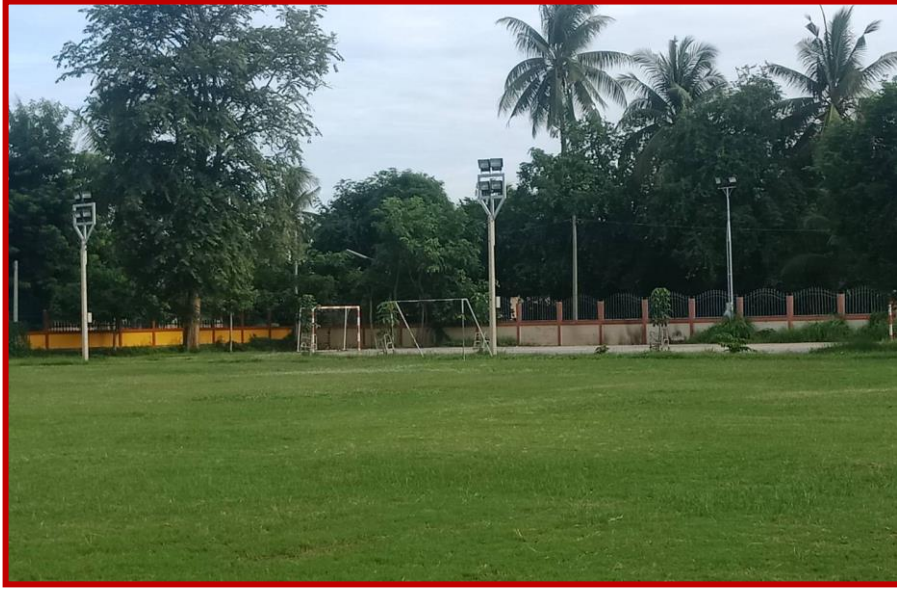
สนามกีฬาโรงเรียนท่าแกวิทยากร หมู่ที่ ๒