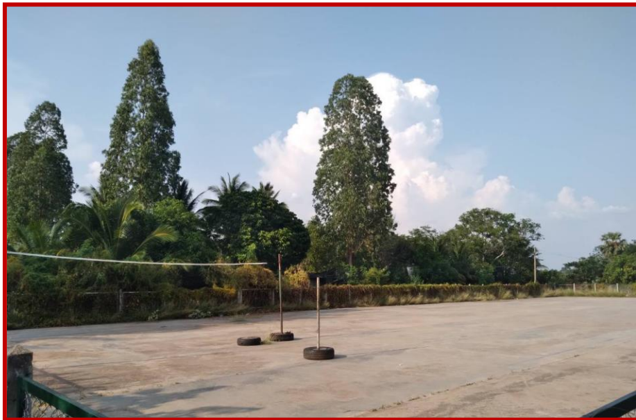
สนามกีฬาโรงเรียนบ้านวังปลาฝา หมู่ที่ ๑๐