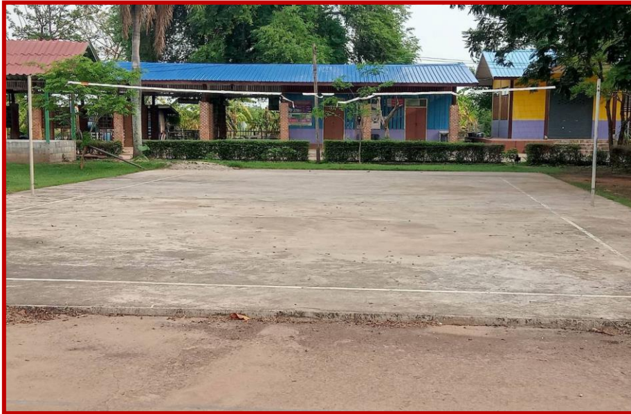
สนามกีฬาโรงเรียนโนนน้อยแผ่นดินทอง หมู่ที่ ๑๓