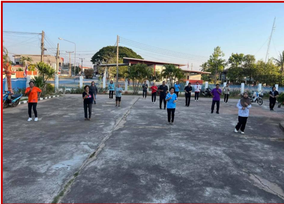
สนามกีฬาโรงเรียนบ้านวังกุ่ม หมู่ที่ ๕