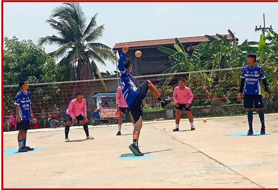
สนามกีฬาโรงเรียนลุ่มลำชีนิรมิตวิทยา หมู่ที่ ๓