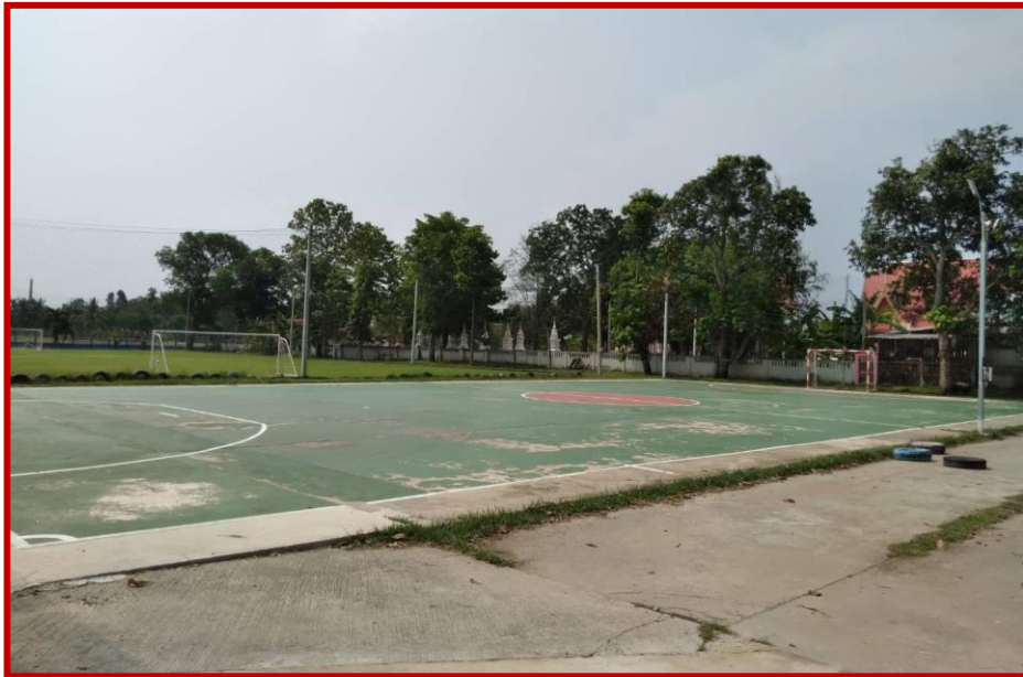
ลานกีฬาชุมชนบ้านท่าแก้ง หมู่ที่ ๙